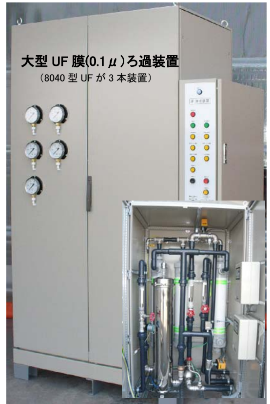
8 m 3 /Hr 用